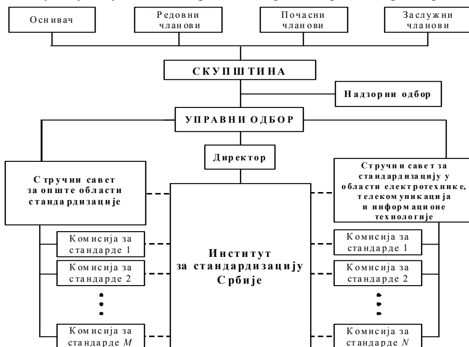
Сл. 1.2 – Шематски приказ органа и стручних тела Института

Органи Института су: Скупштина, Управни одбор, Надзорни одбор и директор (сл. 1.2).