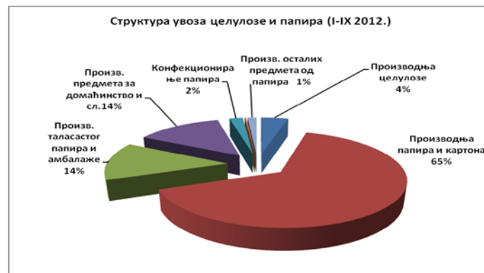
Слика 3 – Структура увоза целулозе и папира

У периоду јануар - септембар 2012. године (према подацима ЦИЕП ПКС) извезено је старе хартије у вредности од око 14,3 милиона долара, односно 97 506 тона, док је увоз реализован у вредности од око 6,4 милиона долара, односно 29 251 тона. У односу на исти период прошле године, извоз старе хартије је опао вредносно за 8,5 %, док је њен увоз опао за 33,2 %.