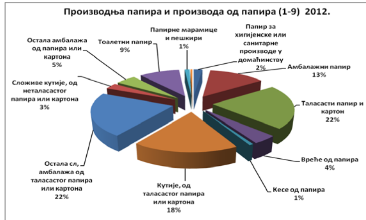
Слика 1 – Графички приказ производње папира и производа од папира

Према подацима Републичког завода за статистику, производња целулозе и папира и прерада папира у Србији (подаци за 2010. годину) организована је у 663 привредна субјекта, где је запослено 7 077 радника. Произвођачи целулозе, папира и картона, као и машина за производњу папира и производа од папира углавном су средња предузећа. Фирме које се у највећој мери баве производњом и прерадом папира у Србији су: